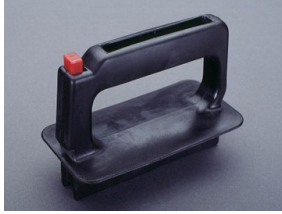
03 502 NH-Aufsteckgriff ohne Stulpe Größe 000 - 3