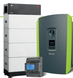
PLENTICORE plus mit KOSTAL Energy Meter

Doppelt gespart und zweifach profitiert: Nutzen Sie daher zusätzlich auch den attraktiven Preisvorteil des KOSTAL Energy Meters.