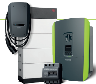
PLENTICORE plus, ENECTOR und KOSTAL Smart Energy Meter