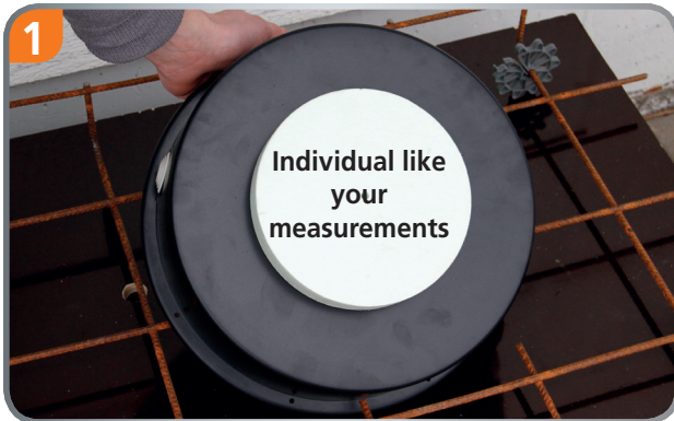
Individual produced opening.