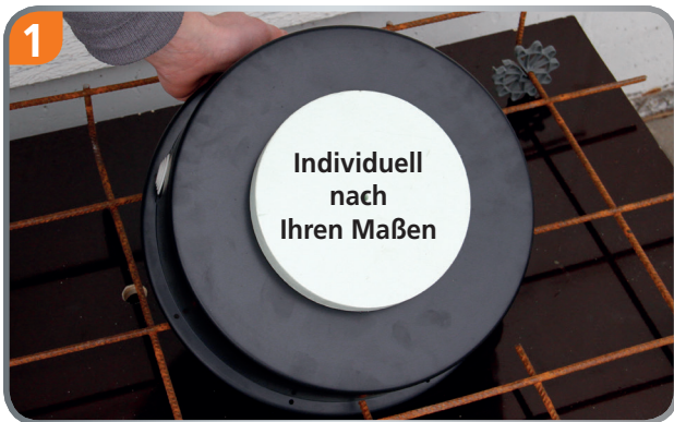
Individuell gefertigte Auslassöffnung.