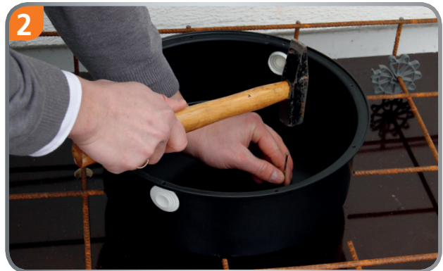
Nail the light-box on the formwork (cast-in-place concrete), paste the light box on the formwork (precast factory).