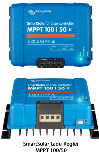
SmartSolar Lade-Regler MPPT 100/50

Apple und Android Smartphones, Tablets und weitere Geräte. - Color Control-Panel