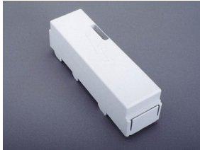
01 590 Abdeckkappe, 3-polig 54 mm breit 54 x 200 x 55