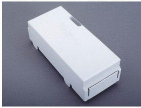
01 413 Abdeckkappe, 3-polig 84 mm breit 84 x 200 x 55