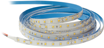
Marra Pro II LED white Marra Pro II LED weiß