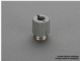
31 006 D02-Schraubkappe, Kunststoff 400 V E 18