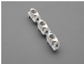
01 647 CUSTO® 60Classic D0-Reiter-Sicherungssockel, 27mm E 18 / 3P