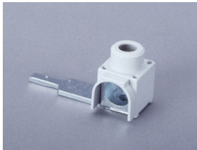
31 029 Anschlussklemme, seitlicher Anschluss für Kammschiene 31 012 6 - 50 mm 2