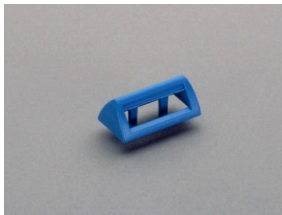
31 086 Bezeichnungsschildträger für Triton, ansteckbar