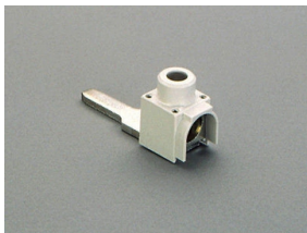
31 085 Anschlussklemme, frontaler Anschluss für Kammschiene 31 012 6 - 50 mm 2