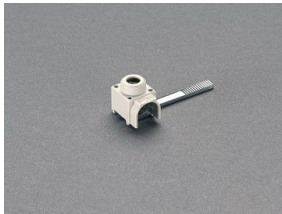
31 103 Anschlussklemme, seitlicher Anschluss für Kammschiene 31 101 und 31 102 6 - 25 mm 2