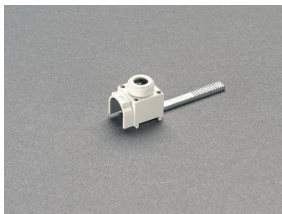
31 157 Anschlussklemme, frontaler Anschluss für Kammschiene 31 101 und 31 102 6 - 25 mm 2