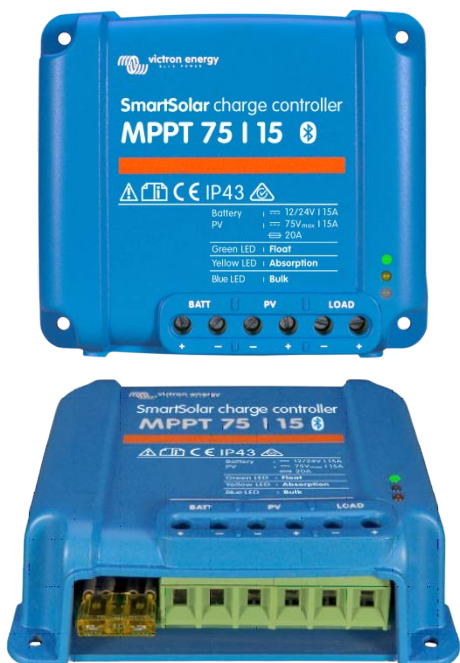
SmartSolar Lade-Regler MPPT 75/15