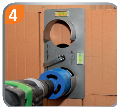
Bohrkrone Ø 82 mm gerade in Bohrschablone einsetzen und Loch ausbohren.