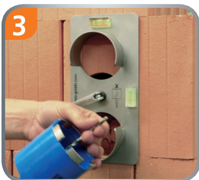
Es wird kein Zentrierbohrer benötigt!