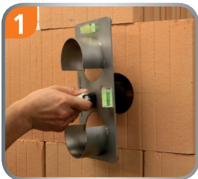
Bohrschablone in Bohrloch einsetzen.