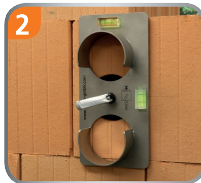
Ins Lot ausrichten und mit Hebel fixieren.