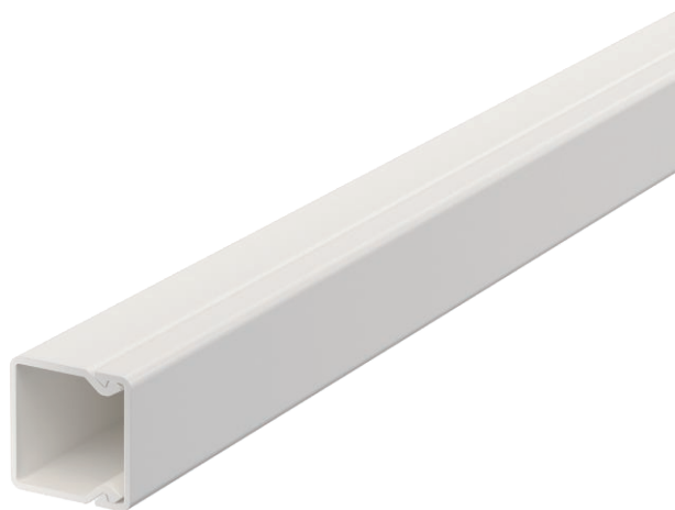
Kanaloberteil und -unterteil mit Bodenlochung.