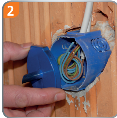
Press on the drill cover.