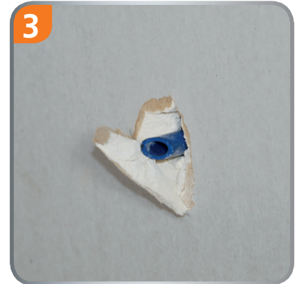
The centre pin serves as the centering for the drill bit.