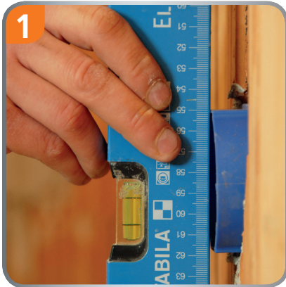
Put the box, let protrude the box 1cm out of the wall.