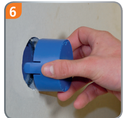
Press on the box cover.