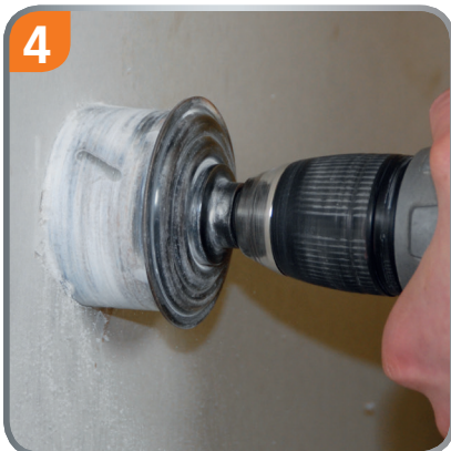
Drill the 68mm hole without re-measure.