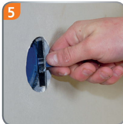
Remove the drill cover.